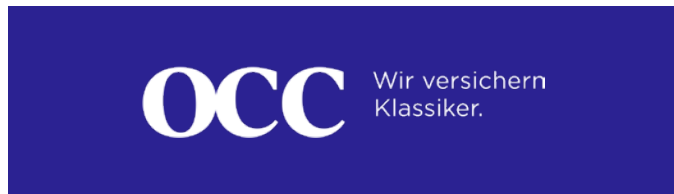
Logo: Die Marke